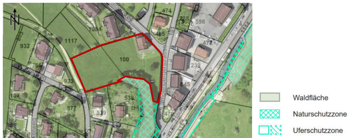
Abbildung 5 Natur- und Uferschutzzonen (rote Umrandung = Bauzonenfläche der Parzelle Nr. 100)

Im Waldbaulinienplan "Stollten" wird die Naturschutzzone insofern berücksichtigt, als dass die Waldbaulinie an Stellen, wo die Naturschutzzone über die statische Waldgrenze hinausgeht, mit 10 m bzw. 15 m Abstand zur Naturschutzzone festgelegt wurde (ausgenommen Parzelle Nr. 538). Da die Naturschutzzone im nördlichen Waldabschnitt deckungsgleich mit dem Waldgebiet ist, ist davon auszugehen, dass auch mit dem Abstand von 10 m bzw. 15 m ein angemessener Abstand zur Naturschutzzone eingehalten wird.