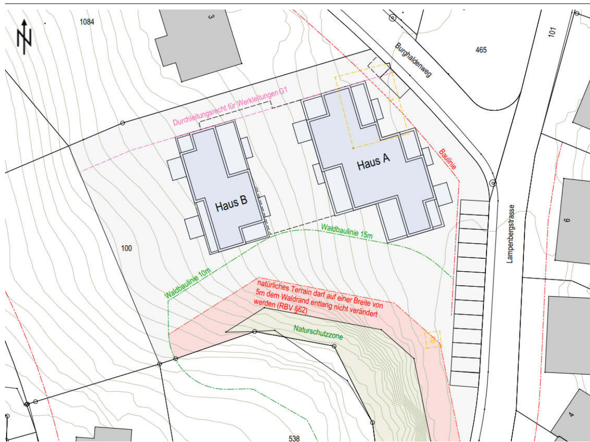
Abbildung 9 Vorprojekt (Vorabzug Stand 27. Januar 2023), Otto Partner Architekten AG

Hinzu kommt, dass gemäss aktuellem Vorprojekt (siehe Abbildung 9) das geplante Bauvorhaben nur an zwei Stellen an die Waldbaulinie zu liegen kommt. Dabei ist zu beachten, dass es sich in beiden Fällen um "punktuelle" Berührungen handelt und nicht um parallel zur Waldbaulinie verlaufende Gebäudefluchten.