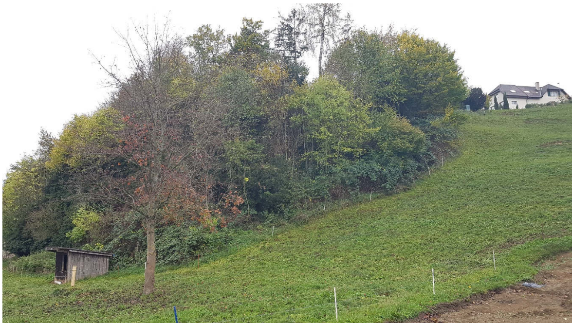
Abbildung 4 Bestockter Steilhang auf Parzelle 100, Blickrichtung Süden

Aufgrund der oben aufgeführten Beschreibung, wie auch der erfolgten Besichtigung von Ort (s. Abbildung 7), lässt sich erkennen, dass es sich dabei um eine Bestockung auf einem Felsaufschluss handelt. Ein Auswachsen dieser Bestockung und einer damit verbundenen Entwicklung mit vermehrtem Aufkommen von Waldbäumen soll mit den in den Zonenvorschriften definierten Pflegemassnahmen bewusst unterbunden werden. Bereits in den Vorabklärungen zum Erlass der Waldbaulinie auf der hangoberseitigen Parzelle Nr. 538 wurde von den kantonalen Fachstellen auf die Erforderlichkeit eines Pflegeeingriffs für diese Bestockung hingewiesen. Seitens der Eigentümerschaft der Parzelle Nr. 100 nun ein Pflegeeingriff im März 2023 vorgesehen. Mit dem Pflegeeingriff wird auch dem Sicherheitsaspekt nachgekommen.