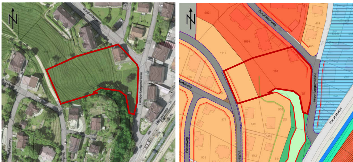
Abbildung 1 Verortung Planungsgebiet (rote Umrandung = Bauzonenfläche der Parzelle Nr. 100)

Die Bebaubarkeit des unteren Teils der Parzelle Nr. 100 wird durch den gesetzlichen Waldabstand eingeschränkt. Durch die Festlegung einer Waldbaulinie soll die Bebaubarkeit der Parzelle Nr. 100 verbessert werden. Gleichzeitig soll die rechtskräftige Strassenbaulinie entlang des Burghaldenwegs ergänzt werden, sodass der Bauabstand zur Strasse entlang des gesamten Strassenabschnitts einheitlich bleibt.