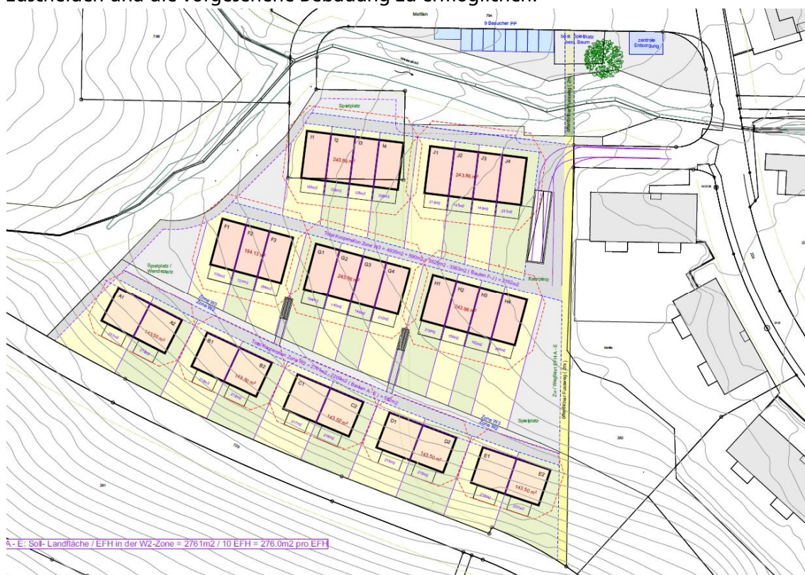
Abbildung 1: Bebauungskonzept Otto Partner Architekten, Situation EG (Entwurf 07.04.2022)

Im Jahr 2013 wurde aufgrund eines Projekts eines Investors ein Quartierplan (QP) auf dem Gebiet ausgearbeitet. Durch den Rückzug des Investors wurde das Projekt jedoch nie realisiert, weshalb der Gemeinderat zum Schluss kam, nach weit über 5 Jahren die Widerrufung des Regierungsratsbeschlusses über den QP zu beantragen. Somit konnte dafür der neue Investor, die Bautreuhand Turi mit den Architekten Otto Partner, ein Projekt für das Gebiet Mettlen Ost planen. Die Planung tangiert jedoch auch den heute geltenden Gewässerraum nach Übergangsbestimmungen. Bis zur Genehmigung eines von der Gemeinde beschlossenen Gewässerraums gelten für alle Gewässer im Siedlungsgebiet Abstandsvorschriften für Gebäude von 8 m plus die Breite der bestehenden Gerinnesohle. In der Folge hat die Gemeinde beschlossen, eine Mutation der Zonenvorschriften Siedlung im Bereich des Mettlenbächlis vorzunehmen, um nach Vorgabe des §12a RBG Gewässerräume auszuscheiden und die vorgesehene Bebauung zu ermöglichen.