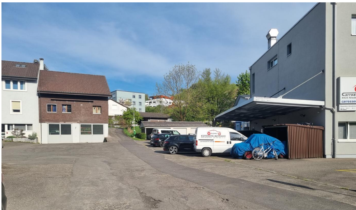
Abbildung 4: Gewerbezone im Bereich des eingedolten Abschnitts