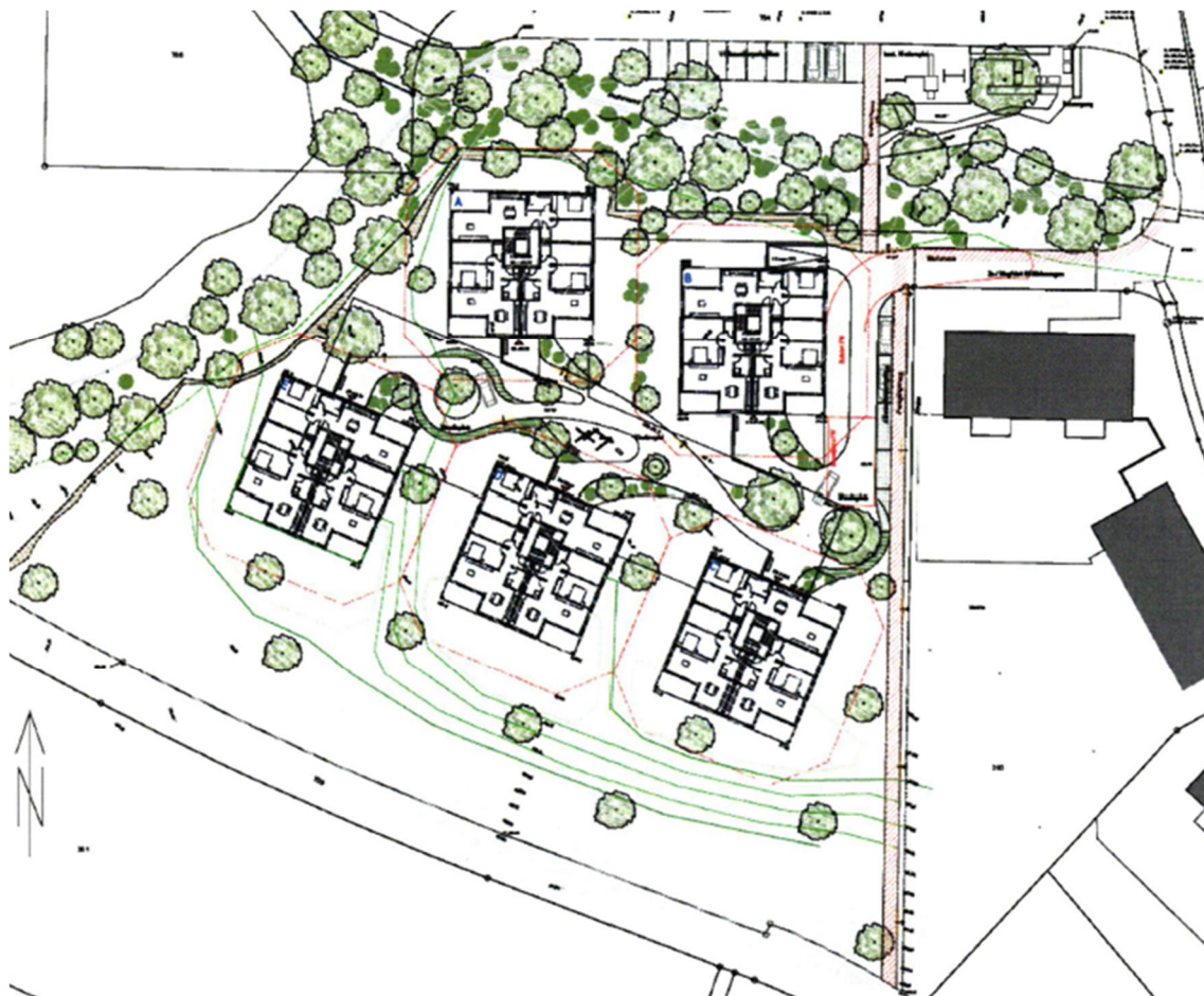
Abbildung 2: Bebauungskonzept Otto Partner Architekten, Situation (Ausschnitt Gemeinderatssitzung vom 26.06.2023)

Mittlerweile haben die Architekten Otto Partner ihr weiteres Interesse an dieser Parzelle angemeldet und haben das Konzept überarbeitet. Nun ist eine Wohnüberbauung mit fünf Mehrfamilienhäusern und einer Autoeinstellhalle geplant. Der Verkauf an die Architekten wird der Gemeindeversammlung vom 20. November 2023 vorgelegt.