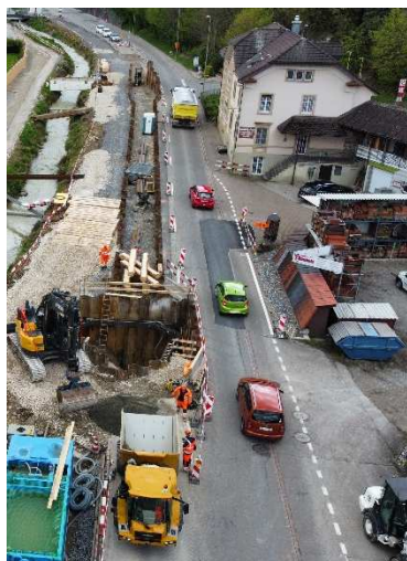
Ampel im Bereich Kanalisation Hauptstrasse